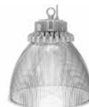
Option: réflecteur polycarbonate 70°