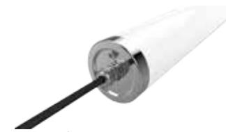
Option: Embout - Presse étoupe - Inox 316L