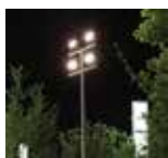
Montage en haut de poteau